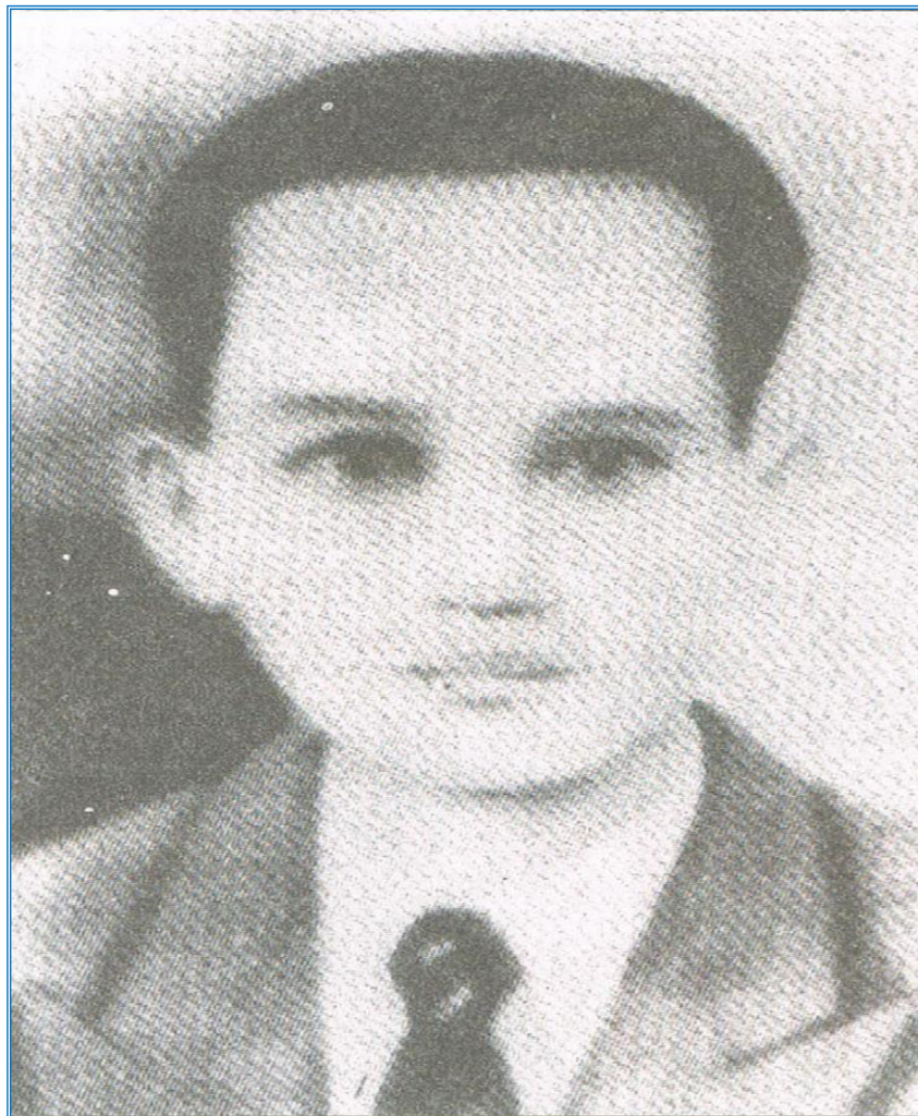
THIỆU TƯỚNG DƯƠNG VĂN DƯƠNG (1900 – 1946) VỊ THIỆU TƯỚNG ĐẦU TIÊN CỦA NAM BỘ