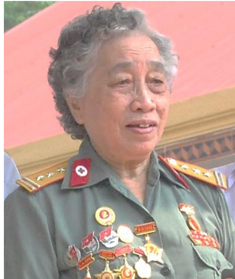
Nguyễn Thị Định