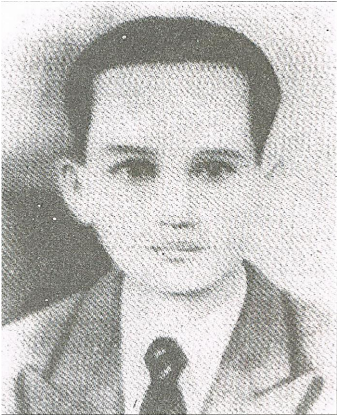
DƯƠNG VĂN DƯƠNG

Thiếu tướng Dương Văn Dương được sinh ra trong một gia đình nghèo ở Cù lao Minh, tỉnh Bến Tre năm 1900.